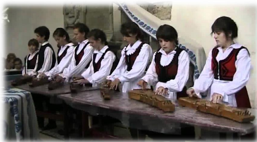
Nagyajtai Áfonya citeraegyüttes

Alkalmi együttesek azok, amelyeknek nincs hagyományosan meghatározott fölállása, létszáma. Pl.: citeraegyüttesek.