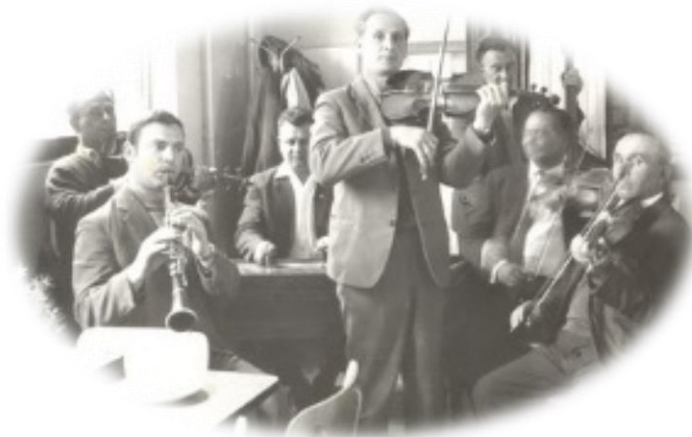
Tiszavasvári – Búdszentmihály - Kálniczki zenekar

Az állandó együttesek tagjai félhivatásos vagy hivatásos zenészek. A hangszerösszeállítás, létszám, és játéktípus nagyobb területi és hagyománybeli egységet mutat.