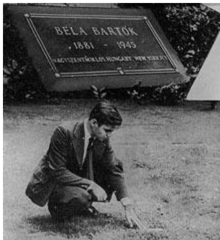
Ifj. Bartók Béla az apja New York-i sírjánál

Bartók 1945. szeptember 26-án halt meg New Yorkban.