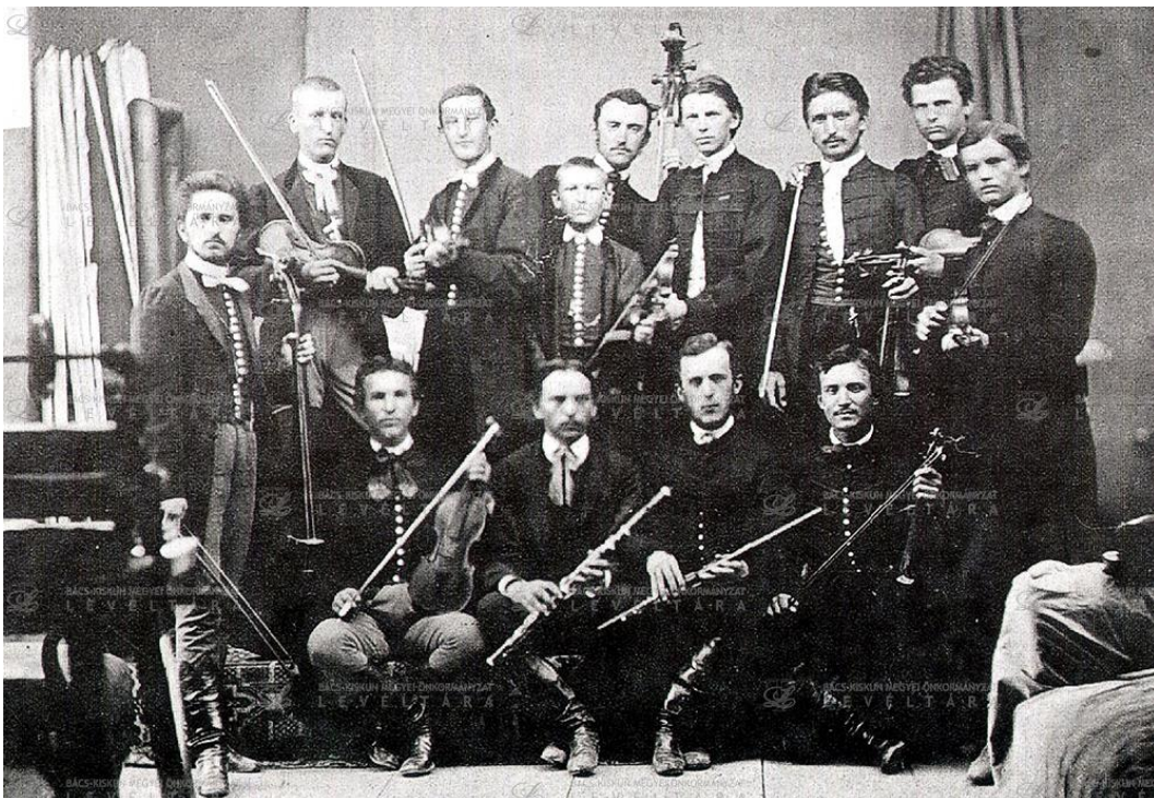
Az Úri Banda (műkedvelők zenekara) 1900 előtt.

A parasztszervezetek nem hivatásos zenészek, emiatt nem követik olyan gyorsan a divatot, hagyományosabban, népiesebben játszanak. Műkedvelők lévén a képzetesebb, technikásabb cigánybandákat utánozzák.