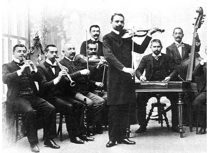
Kolozsvári cigányzenekar az 1890-es évekből

A különböző etnikai csoportok igényeit egyaránt kiszolgálják. A hangszerösszeállítás a helyi igényekhez igazodik.