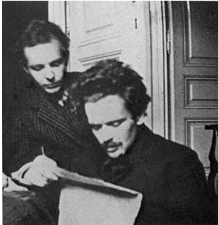
Bartók Béla és Kodály Zoltán, a Zeneakadémia két ifjú tanára

„A magyar népdal szép. Szép nekünk, magyaroknak. Szép másoknak is, vagy azért, mert kuriózum, az övéktől eltérő, vagy, mert olyan zenei jegyeket hordoz, melyeket valahonnan már ismernek. Alapvetően azonban nekünk szól. A mi belső húrjainkat pendíti meg. De nem biztos, hogy ösztönösen. Kevés az olyan ember, aki erre önmagától ráébred. Általában kell egy összekötő, egy rávilágító, egy megmutató mester, egy „guru”. Lehet ez barát vagy szülő, egy táncház vezető vagy muzsikus. De lehet egy zenetanár is, aki megértetheti tanítványival, hogy aki „meghallja” és „megérti” a népdal üzenetét, egész életére fel lesz vértézve a percértékű divatirányzatok ellen és olyan fogódzót, olyan biztos gyökeret, talajt épít ki magának, melyhez élete folyamán bármikor visszatérhet, amelybe bármikor belekapaszkodhat, és amelytől fontos kérdéseire bármikor választ kaphat.”